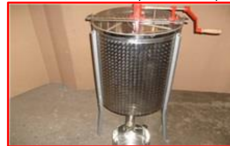
K-460, 4- rámkový