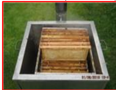
Nádoba na vytáčení vosku z voští (parafinovací nádoba)