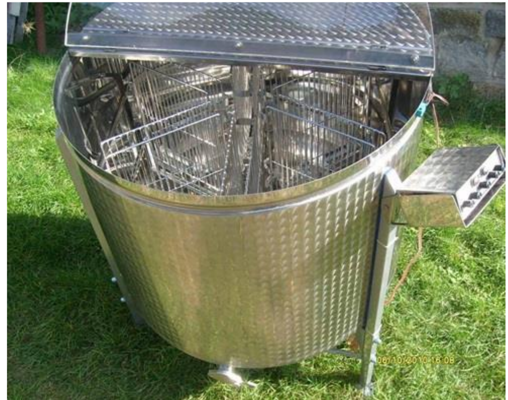
A-910 6- rámkový medomet (39x32)