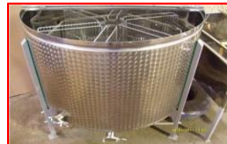
M-1010, 6- rámkový automatický