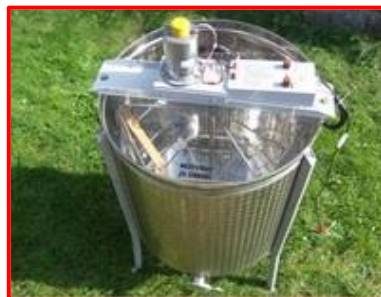
K-630, 6- rámkový