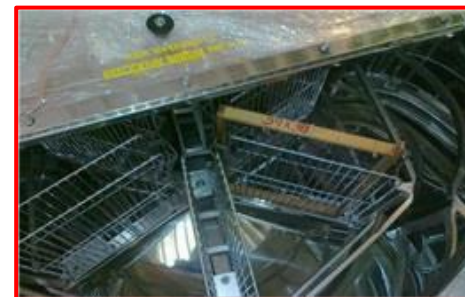
A-910, 6- rámkový, automatický